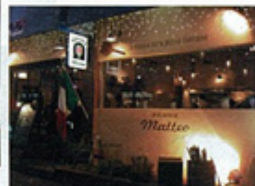
▲綺麗な装飾の外観が目を引きます