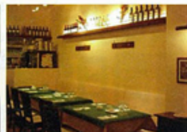
▲雰囲気のあるゆったりした店内

●所在地/中央区銀座7-2 銀座コリドー街111 ●営業/月~木 11:00~23:00(L.O.22:00) 金 11:00~23:30(L.O.22:30) 土 11:00~22:30(L.O.21:30) 日祝 11:00~22:00(L.O.21:00) ●TEL/03-3572-1062