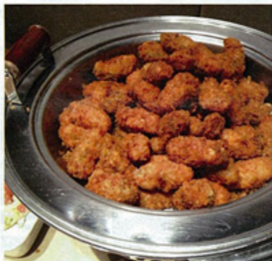
▲ふっふりの新鮮な牡蠣のフライがお腹いっぱい食べられる♪